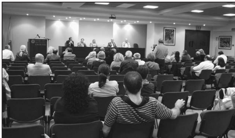
I partecipanti all'incontro del Centro Fiera.

PERCHÉ le minoranze sono costrette a ricorrere al Tar per accedere agli atti?