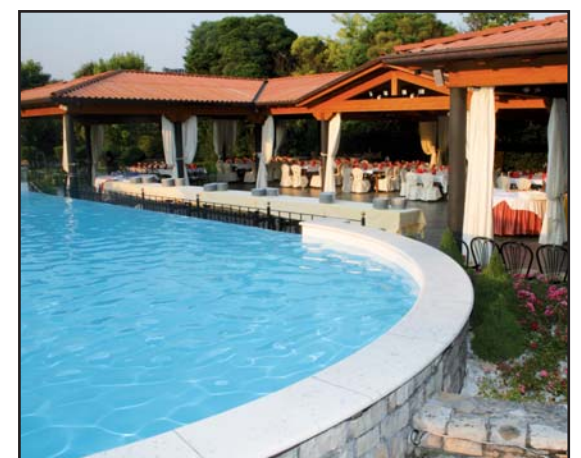
Green Park Boschetti: la festa a bordo piscina.