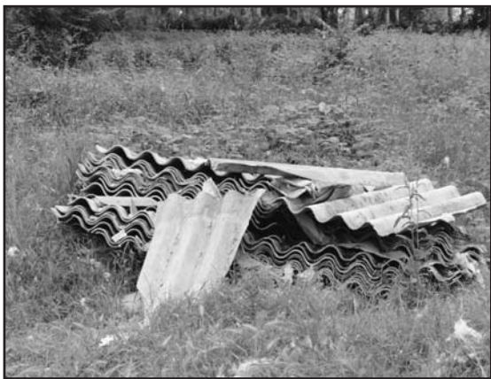
Lastre di eternit abbandonate nei pressi della Traada.

Acqua passata, ora ci sono da gestire alcuni milioni di euro