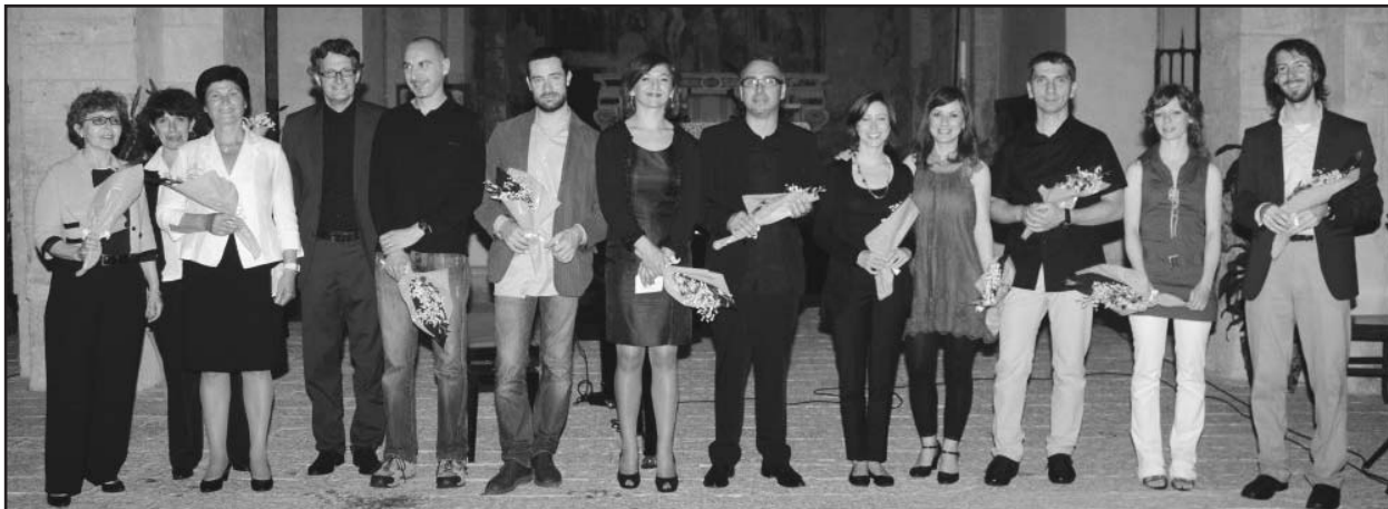
I componenti la Scuola d'Archi Pellegrino da Montechiaro.